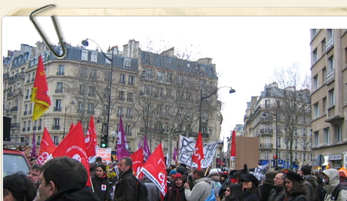
Des centaines de psychologues devant le Ministère de santé, Paris.

Blake, W. (1793). Le mariage du Ciel et de l'Enfer .