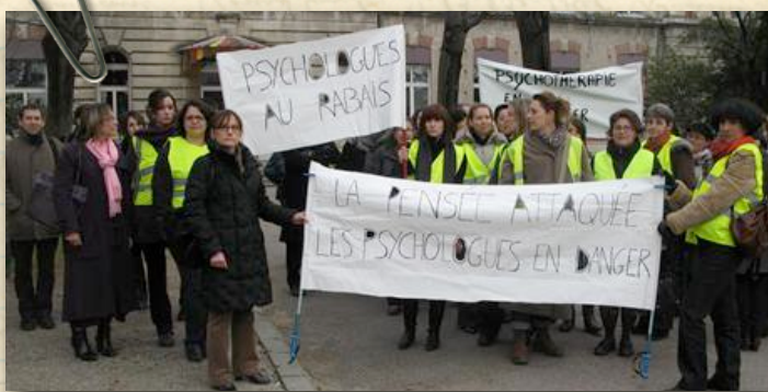
Les psychologues drômois et ardéchois, fonction publique comme secteur privé, se sont mobilisés vendredi pour défendre leur profession que de nouvelles réglementations « mettent sérieusement à mal. » Le Dauphiné .

Ils sont peu coutumiers du fait. Mais vendredi 28 janvier, à l'appel de plusieurs organisations syndicales, les psychologues drômois et ardéchois étaient majoritairement en grève. Ceux regroupés dans le collectif des psychologues Drôme/Ardèche se sont rendus à l'ARS territoriale de la Drôme. Une délégation a été reçue par son directeur. « Je suis curieuse de savoir ce qu'il connaît de notre statut », commente une psychologue. Un statut qui peut faire du psychologue un nomade, alternant exercice public et exercice privé. On le rencontre à l'hôpital, à la Protection judiciaire de la jeunesse, dans l'Éducation Nationale... Son temps de travail est « très morcelé, très fragmenté » avec quelques heures par ci, quelques heures par là. La moitié des psychologues sont contractuels. La tendance est à la hausse. Ainsi sur les 27 psychologues qui travaillent dans les Hôpitaux du Nord Drôme (Romans et Saint-Vallier), sept sont titulaires. Une circulaire du 4 mai 2010 et les décrets du 20 mai et 4 novembre 2010 « précarisent » un peu plus la profession quand ils ne la dénaturent pas. « Notre niveau de qualification est remis en question.