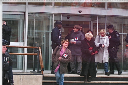
Délégations au Ministère - CGT, Sud Santé, UNSA, FFPP & RNP