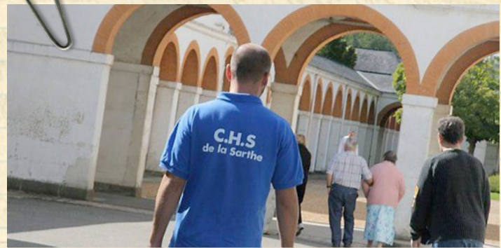
Autre problème, en plus de celui des psychologues, celui des infirmiers. Confronté à la pénurie, les hôpitaux peuvent désormais recruter des retraités. Ce qu'a fait le CHS en fin d'année, en proposant des postes à temps partiel à un grand nombre d'infirmiers récemment retraités.

Les contractuels n'ont pas d'évolution de carrière possible. Ils restent à l'échelon 1 ou 2, ne touchent pas de prime salariale.